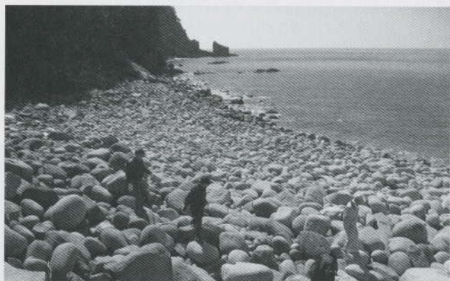
元盛松・ゴロタ浜