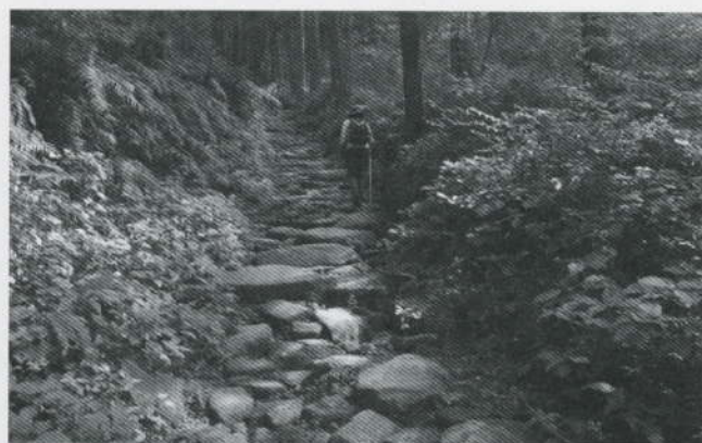
エコツアー初めての熊野古道・馬越峠

このように観光、地域、経済などバランスの取れた観光のあり方であるエコツーリズムを推進し、「持続可能な観光」が定着するよう事業を展開している。